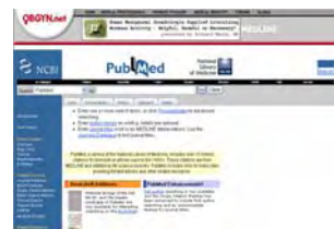
หน้าโฮมเพจของ PubMed

( www.ncbi.nih.gov ) PubMed จัดทำโดย NIH (National Institutes of Health) ให้บริการค้นข้อมูลจาก Medline ได้ฟรี ผู้ใช้ไม่ต้องลงทะเบียน มีรายชื่อวารสารให้บริการโดยเลือกที่ Journal Browser