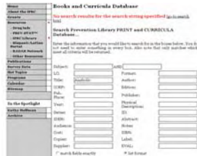
หน้าสืบค้นเว็บไซต์ห้องสมุด

2. แหล่งข้อมูลยาแหล่งที่ 2 ที่อยากแนะนำให้เข้าไปใช้กันได้แก่ HealthGate ( www.healthgate.com ) เป็นเว็บไซต์หนึ่งที่สามารถค้นหาข้อมูลใน