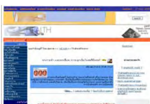
หน้าโฮมเพจของ Thai Health

ยังให้ข้อมูลเกี่ยวกับยา มี Medical Encycropedia บริการ