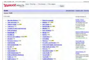
หน้าเว็บเพจของ Yahoo Health

เข้าไปใน Health จะปรากฏหัวข้อเกี่ยวกับสุขภาพมากมาย โดยตัวเลขข้างหลังหัวข้อนั้นคือจำนวนเว็บไซต์ที่เกี่ยวข้องกับหัวข้อนั้นๆ