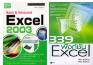
Basic & advanced Excel 2003 และ 339 ฟังก์ชัน Excel