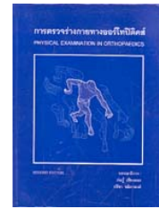
การตรวจร่างกายทางออร์โธปิดิกส์

30. ตำราการปลูกถ่ายไต / บรรณาธิการ โดย โสภณ จิรสิริธรรม และคณะ RD575\ต367\ 2547 (4800133)