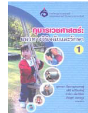
กุมารเวชศาสตร์ : แนวทางวินิจฉัยและรักษา