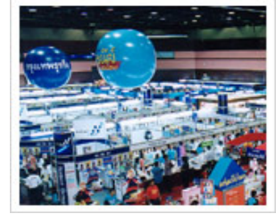
ภาพกิจกรรมงานสัปดาห์หนังสือแห่งชาติ ครั้งที่ 33 และ สัปดาห์หนังสือนานาชาติ ครั้งที่ 3